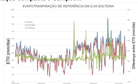
Figura 1. Comparação entre a evapotranspiração da estação compacta e Campbell.

Na Figura 2 é possível observar que as duas estações apresentam uma correlação entre os dados com o valor do R 2 de 0,89 sendo este valor considerado ótimo.