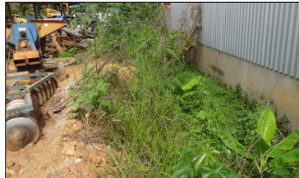
Pelo que vemos o local onde estão estes maquinários, está faltando limpeza pois matagal pode gerar mosquitos da Dengue