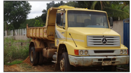
Caminhão basculante Mercedes Benz - Informação extra oficial é que está com motor batido - Placa MQT - 1505.