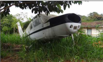
Esta aeronave está estacionada em terreno da Prefeitura, segundo informações extra oficial, com problemas mecânico