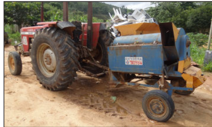
Trator Massei Ferguson - 265. Informações extra oficial é de que está com problemas de motor.