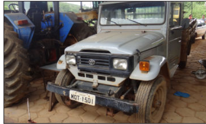
Caminhonete Toyota, Placa MQT- 1501 Informações extra oficial dão conta de que está com problemas de motor.