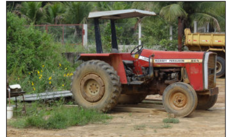
Trator Massey Ferguson - 265. Informações extra oficial dão conta de que está com problema mecânico