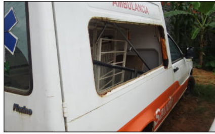
Fiat -Ambulância em péssimo estado de conservação - Placa MQB - 7470