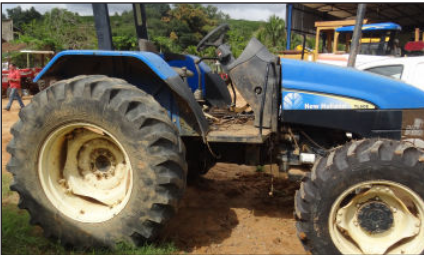
Trator New Holland - TL60-E. Informações extra oficial é que está com problemas de motor