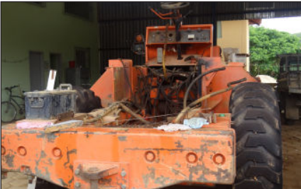
Pá Carregadeira - Fiat Allis - Informações extra oficial é de que está com problemas de motor