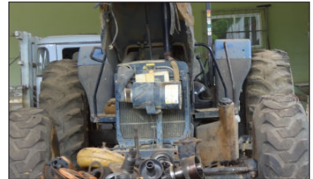
Trator New Holland - TL-85-E. Informações extra oficial dão conta de que está com problemas de motor.