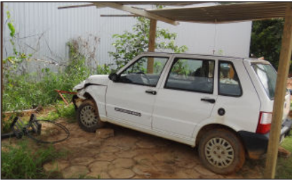
Fiat Uno - Batido - placa MPQ 2101. Mais um carro sucateado